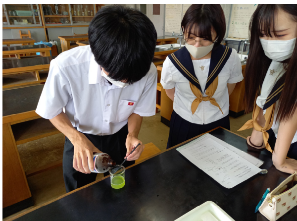
調査研究 A :高等学校の新教科「理数科」に関する研究 研究協力校で授業の様子を取材しました。