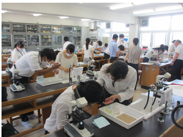
児童生徒の理科離れ対策事業 小学校初任者を対象に、「理科観察実験・実習研修」を実施しました。