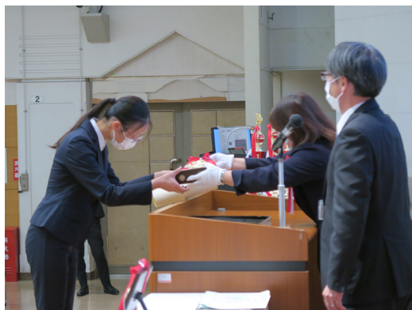
科学作品展 表彰式(10/19) 当センターにおいて、特別賞、優秀賞、優良賞、科学技術賞の表彰を行いました。