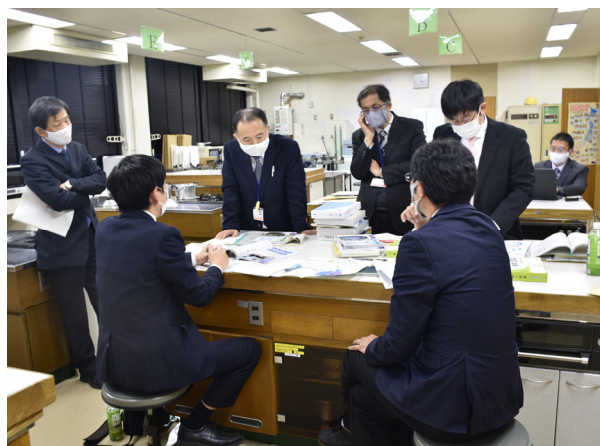
調査研究 B :小・中学校理科における科学的に探究する学習の進め方に関する研究 研究協力員会議を開催しました。