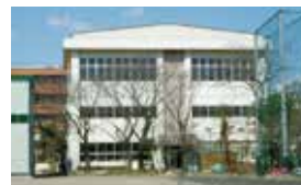
旭中学校 相談学級