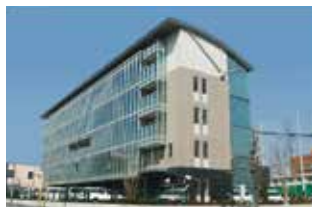
宇都宮市教育センター

このような学校の様々な取組によってもどうしても登校できずに困っている子のために、宇都宮市には、教育センターを中心とした支援の場があります。