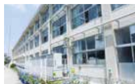
築瀬小学校 相談学級 (南校舎 1階)